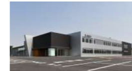
エイベックス株式会社

変化の激しい未来を生き抜くため、アクティブラーニング型授業を展開し、最先端のICT環境を活用して深い学びを実現しています。当日は、小学生の清掃や配膳の様子をご覧いただいたり、中学生による発表をお聞きいただく予定です。